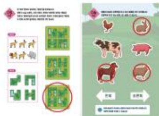
○ 워크북 정답 해설지