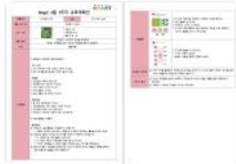
○ 주차별 교육계획안