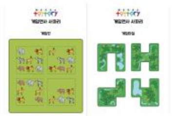
○ 활동자료 (A3 인쇄용)