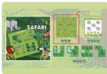
○ 4주차 수업업 PPT